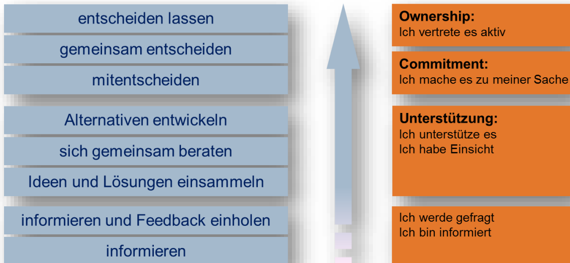
Abbildung 3: Ebenen der Einbeziehung

Darüberhinaus spielt auch der Effekt, den eine Delegationsstufe auf die Mitarbeiter hat, eine Rolle. Zur Verdeutlichung verwenden wir in unserer Arbeit mit Führungskräften ein eigenes Modell und sprechen von den Ebenen der Einbeziehung. Die verschiedenen Stufen und ihr Einfluss auf das Commitment und die Akzeptanz auf Seiten der Mitarbeiter sind in Abbildung 3 dargestellt.