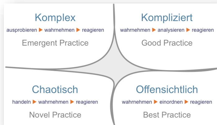
Abbildung 1: Cynefin Modell (nach Dave Snowden, 2007)

In manchen Unternehmen müssen selbst die kleinsten Entscheidungen (bspw. über den Kauf eines neuen Druckers) über zwei bis drei Hierarchieebenen entschieden werden. Man stelle sich nur vor, wie viel Zeit dann wichtige Entscheidungen beanspruchen.