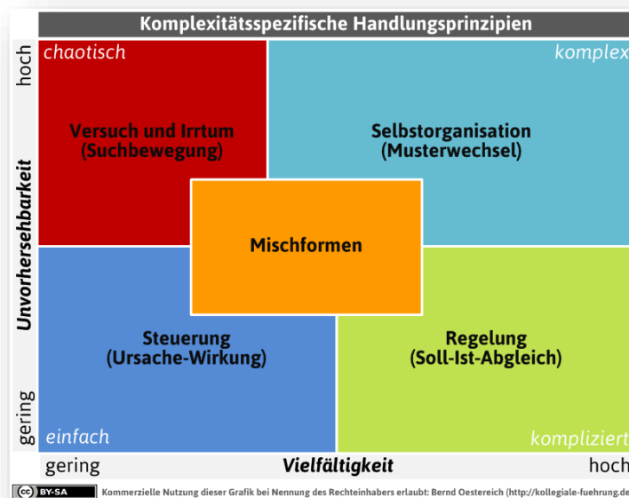
Abbildung 2: Komplexitätsspezifische Handlungsprinzipien

Die nachfolgende Abbildung zeigt ferner auf, in Bezug auf welche Situationen Selbstorganisation die bevorzugte Management-Weise darstellt.